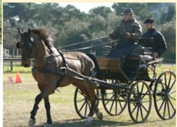
Il team Tortella