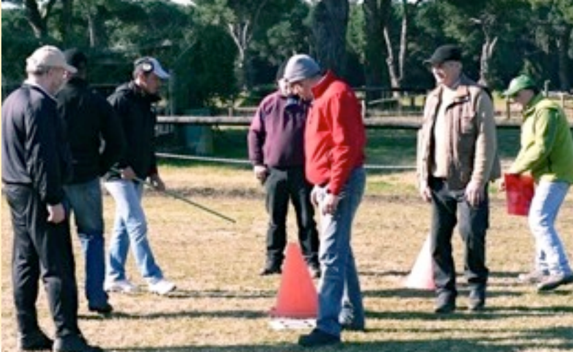
I guidatori collaborano all'allestimento dei percorsi