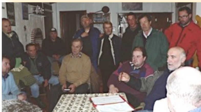
Una delle riunioni serali dopo gli allenamenti