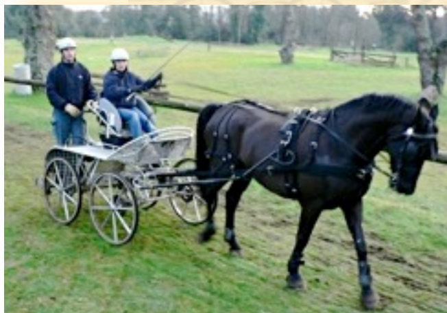
Il team Onofrio