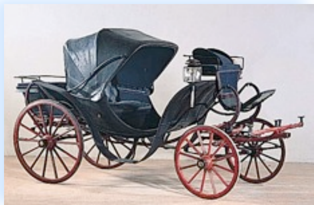
Vettura esposta a Palazzo Farnese Comune di Piacenza

La Victoria ( a destra nella foto) è un modello nato intorno alla metà del 1800, sotto il regno della regina d'Inghilterra, da cui prende il nome. Deriva dal Duc al quale, forse - col senso di praticità che caratterizza gli Inglesi - è stata aggiunta, al di sopra del grande parafrangente a ventaglio anteriore, una cassetta di guida