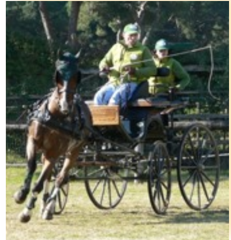
Il team Cavina