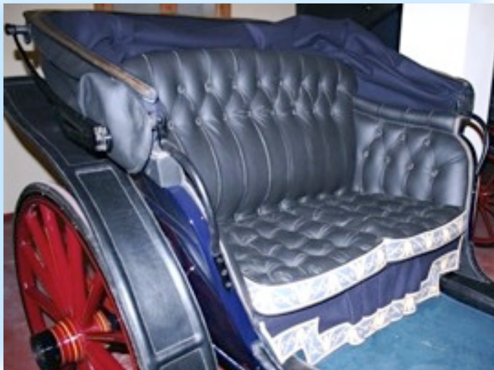
Particolare del sedile di una Mylord

Sulle carrozze vennero per prime sperimentate le tecnologie che ritroviamo sulle moderne auto. La continuità storica tra la carrozza e l'automobile è testimoniata dal