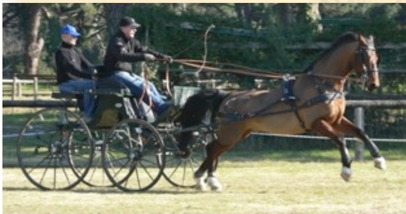
Il team Cotti