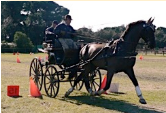
Il team Arcioni